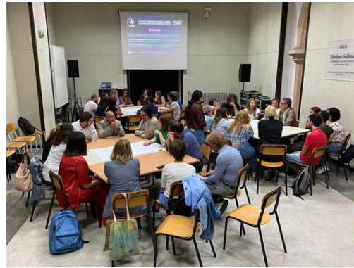
Ilustración 2: Portada del workshop desarrollado por ARTEMIS, y una imagen del desarrollo de las sesiones en la Sala Sollima del Conservatorio di Música Alessandro Scarlatti di Palermo, realizada el día 2 de octubre.

Los integrantes de este proyecto, provenientes de Finlandia, Dinamarca, Francia, España... plantearon diversas cuestiones en torno a la inclusión del alumnado con diferentes necesidades educativas en los estudios musicales superiores, incidiendo en los retos, las resistencias y acciones a realizar en tan apasionante tarea. A través de diversas dinámicas de grupo, se pudieron poner en común diversas percepciones de los diferentes integrantes de la comunidad educativa (alumnado, profesorado, profesionales del mundo de la Musicoterapia, de la Didáctica de la música, etc.), distintos puntos de vista sobre una problemática que concluyó con la necesidad de conocer las problemáticas y necesidades de la comunidad escolar; protocolizar el acceso a la información derivada de la misma; y dotar a los centros del personal necesario, y de una formación mínima para poder atender las diferentes necesidades.