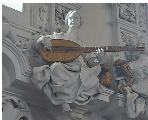
Ilustración 1: Izda. Detalle de ángeles músicos de la Inconoronazione della Vergine tra gli Arcangeli Michele e Raffaele, del "Maestro del polittico di Trapani", proveniente de la Chiesa di San Michele Arcangelo di Palermo (inicios del siglo XV) (Galleria regionale della Sicilia. Palazzo Abatellis, Palermo). Dcha. Detalle de una alegoría de la Música, obra de Giacomo Serpotta, del Oratorio del Rosario de Santa Cita, Palermo).