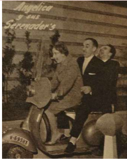
Ilustración 4: Tarjeta promocional de Angélica y sus Serenader's.

Con Angélica y sus serenader's tuvimos mucho éxito, estuve a punto de marcharme a México, que estaba más desarrollado que España; llegó a venir un representante que me prometió hacer grabaciones e incluso películas en México, pero preferí profundizar en mis estudios de música clásica.